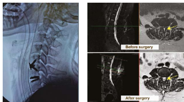
於頸椎（左圖）及腰椎（右圖）進行了「微創椎間盤切除術」。

手術後一天，患者感覺到所有症狀都消失了。他很高興在病房裏以正常平穩及敏捷快速的步態到處走，感到再沒有頭暈和低壓性頭痛，尿頻的症狀也改善了，住院一天後便高興地回家去了。五年後的今天，經過長時間的腦萎縮藥物治療，他的認知功能、記憶力和分析能力都恢復了正常人的水平。