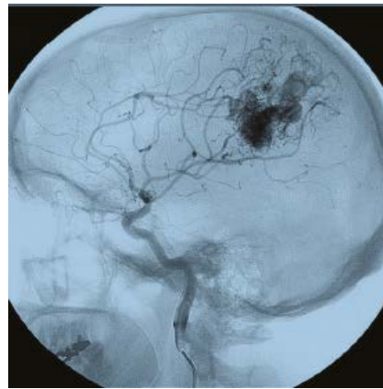
腦動靜脈畸形血管瘤 (Cerebral Arteriovenous Malformation-AVM)。